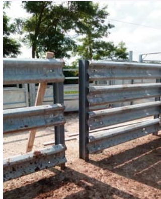
Passage d'homme : la largeur de 0,35 m est suffisante pour le passage