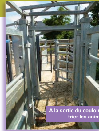
A la sortie du couloir de contention, une barrière permet de trier les animaux et d'envoyer vers la pesée