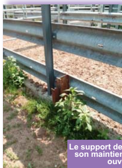
Le support de barrière pour son maintien en position ouverte