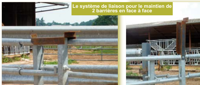
Le système de liaison pour le maintien de 2 barrières en face à face