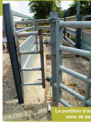
Le portillon d'accès à la zone de pesée