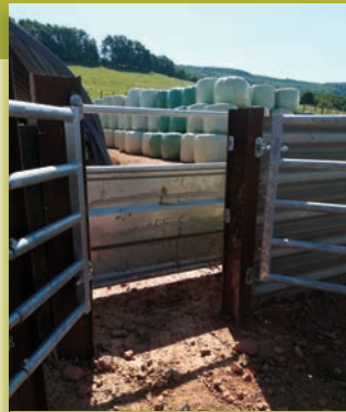
Entrée dans le couloir