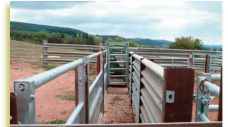
Couloir avec des barrières amovibles à gauche