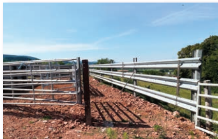
Zone d'embarquement ou de débarquement