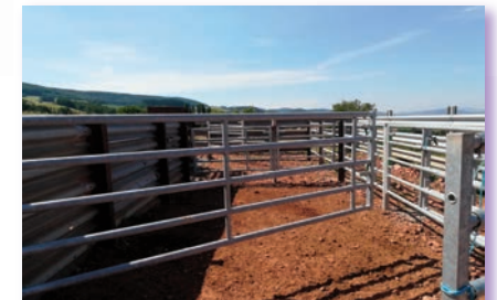
À l'intérieur de l'espace de contention, des barrières orientent le déplacement des animaux