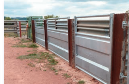
Travail le long du couloir de plain pied