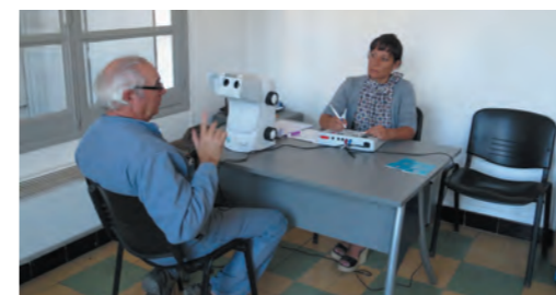
Examen médical d'aptitude