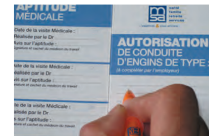
Formalisation par l'employeur

L'évaluation de l'expérience des opérateurs déterminera le temps de familiarisation nécessaire avec la machine (marque et modèle utilisé). Un opérateur de PEMP doit être formé et compétent. S'assurer qu'une personne au sol maîtrise la connaissance des commandes au sol et des commandes d'urgence : localisation et utilisation.