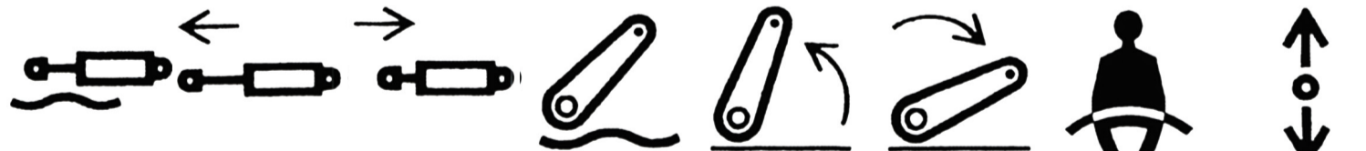
Vérin flottant Vérin de commande Extension Vérin de commande Retour Dispositif de relevage libre Dispositif de relevage lever Dispositif de relevage Abaisser Ceinture de sécurité Inverseur de marche