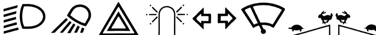
Feux de croisement Feux de travail Feux de signal de détresse Gyrophare Indicateurs de direction Essuie-glace Accélérateur Accélérateur