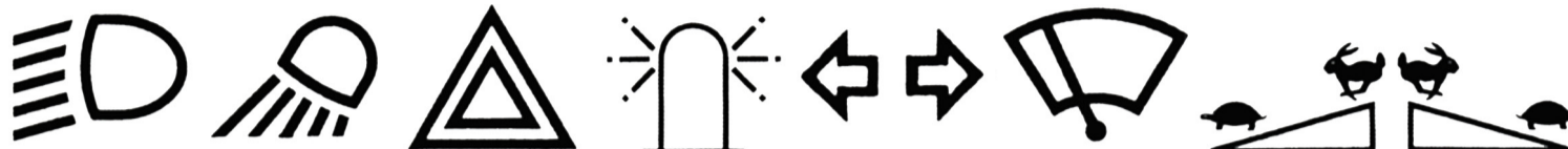
Feux de croisement Feux de travail Feux de signal de détresse Gyrophare Indicateurs de direction Essuie-glace Accélérateur Accélérateur