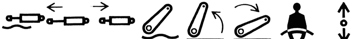
Vérin flottant Vérin de commande Extension Vérin de commande Retour Dispositif de relevage libre Dispositif de relevage lever Dispositif de relevage Abaisser Ceinture de sécurité Inverseur de marche