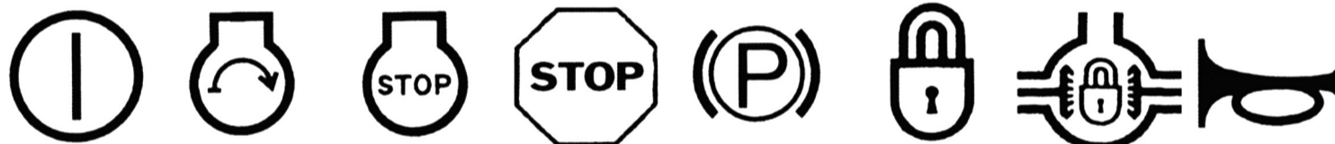
Marche - Arrêt Mise en marche du moteur Arrêt du moteur Arrêt d'urgence Frein de stationnement Blocage Blocage du différentiel avertisseur sonore