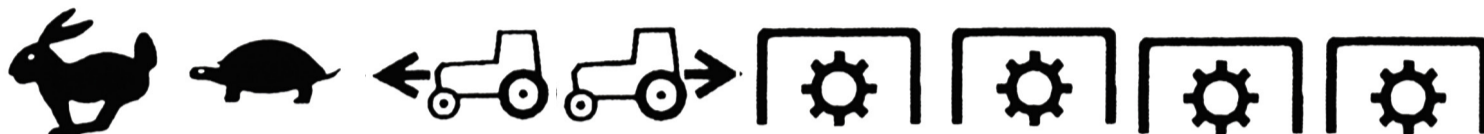
Rapide Lent Sens de déplacement vers l'avant Sens de déplacement vers l'arrière Prise de force Prise de force Prise de force Prise de force